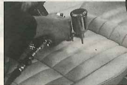
▲経年劣化などで褪色したシートも、33色からなる水性塗料を噴霧して新品時の風合いを復活する