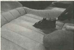
▲穴は特殊なバテまたはスポンジで埋め、グレインペーパー（15種類あり）を使ってシボを再生する